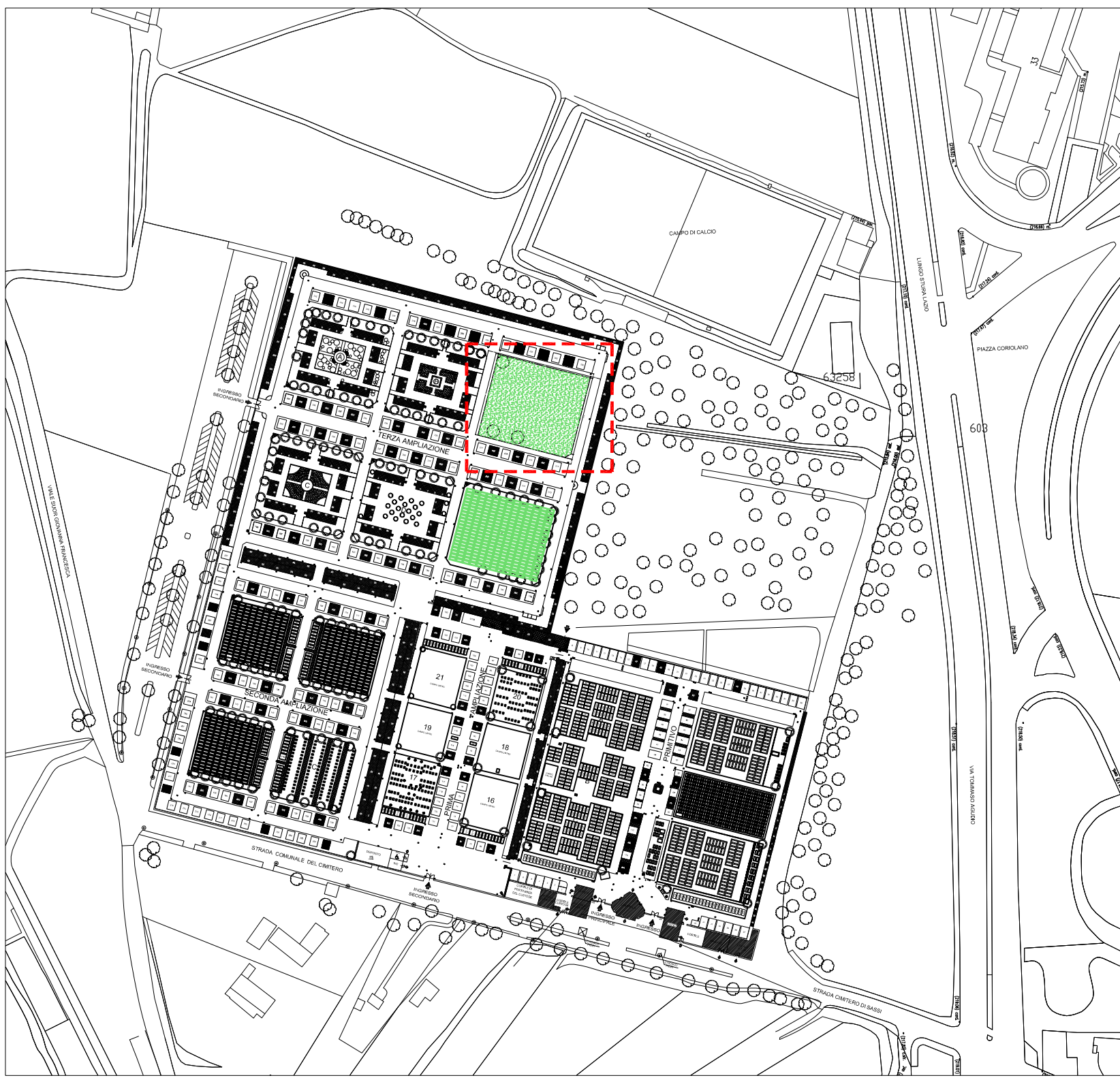
PLANIMETRIA GENERALE DEL CIMITERO - Scala 1/2.000