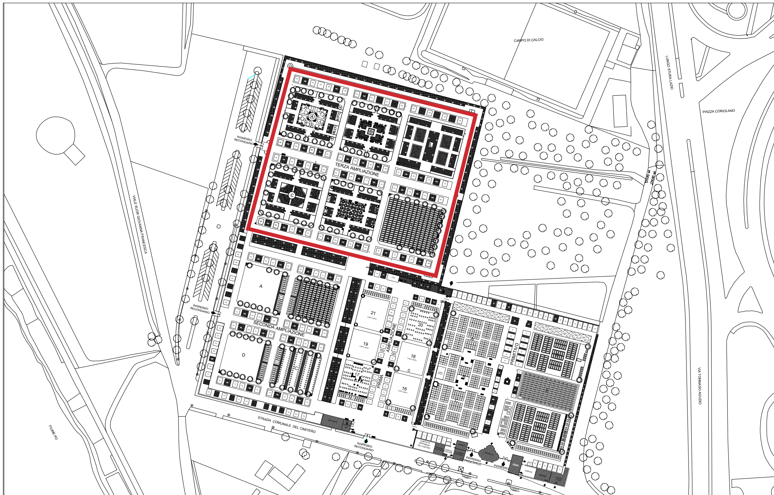
planimetria generale Cimitero di Sassi - Fuori scala